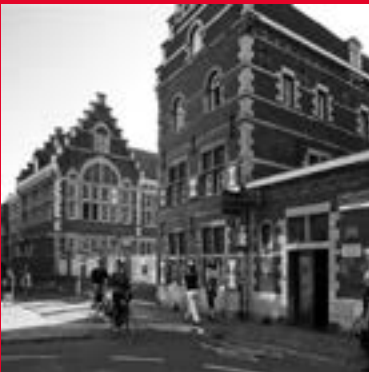
Lenculenstraat 31-33 6211 KP Maastricht