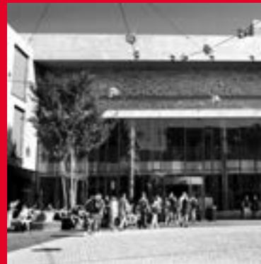
Ligne 1 6131 MT Sittard