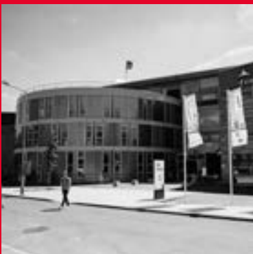
Mgr. Claessensstraat 4 6131 AJ Sittard