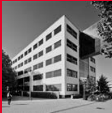
Universiteitssingel 60 6229 ER Maastricht