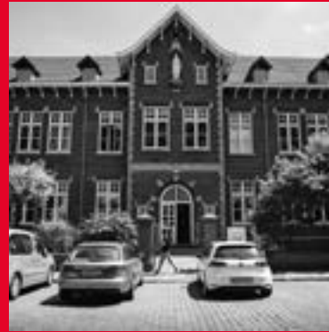
Franciscus Romanusweg 90 6221 AH Maastricht