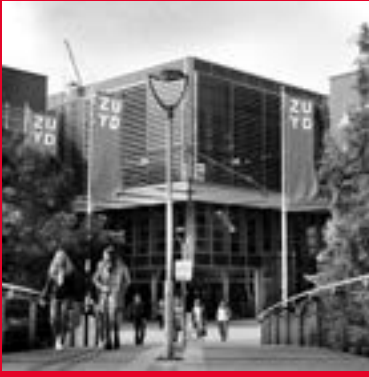
Nieuw Eyckholt 300 6419 DJ Heerlen