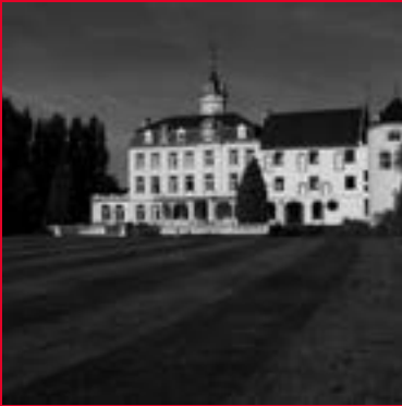
Bethlehemweg 2 6222 BM Maastricht