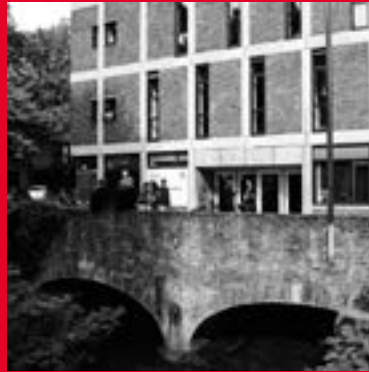
Bonnefantenstraat 15 6211 KL Maastricht