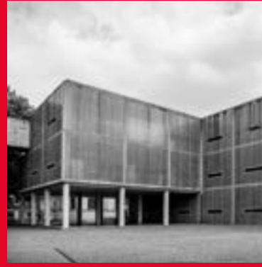
Herdenkingsplein 12 6211 PW Maastricht