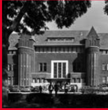
Brusselseweg 150 6217 HB Maastricht